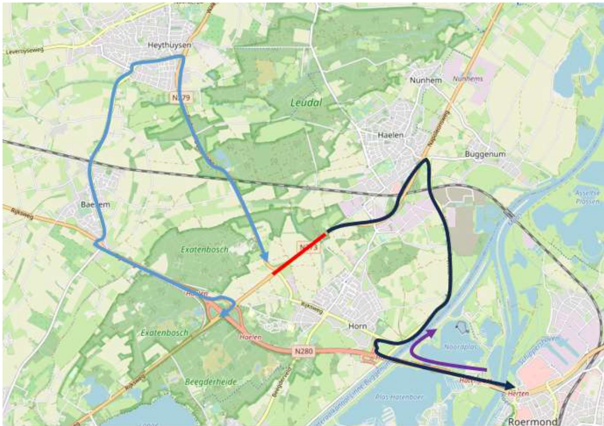
Afbeelding 2 grootschalige en lokale omleiding